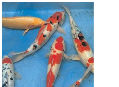
錦鯉の里 山古志や小千谷は質の高い錦鯉の生産地です。泳ぐ宝石といわれるほどの鯉の美しさを堪能してください。