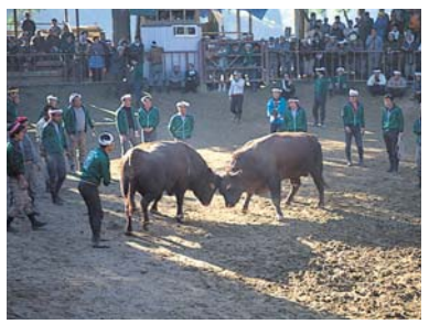
山古志の闘牛 巨体がぶつかる勇壮な牛の角突。400年の歴史を誇り、国の重要無形民俗文化財に指定されています。5月～11月の指定日に開催されます。